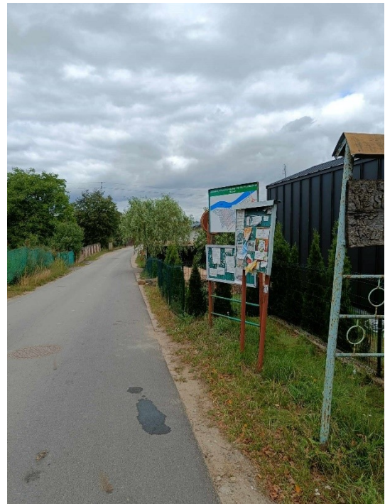
1 pav. Atnaujinti sodo planai (foto iš Kriaušių g.)