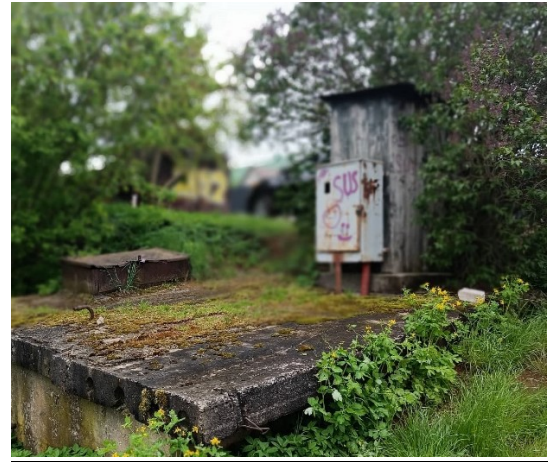
1 pav. Elektros skydas