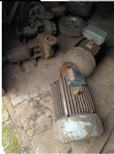
2 pav. Metalinis garažas, kuriame saugomas inventoriūs ir atsarginės dalys